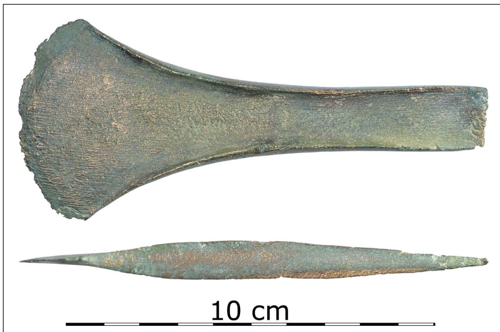
Ryc. 2. Siekierka brązowa, Strumiany, gm. Stargard.