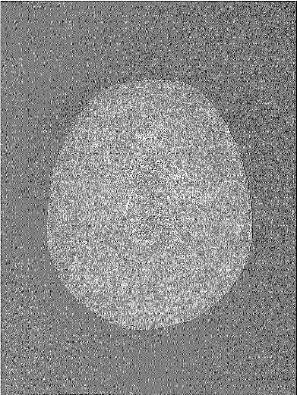
Ilustr. 2. Osobnik II ( norma verticalis ).